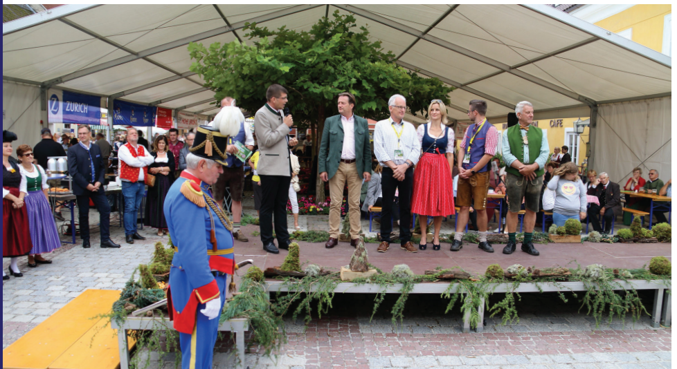
Eröffnung des Holzstraßenkirchtages am 15.07.2018 in Straßburg