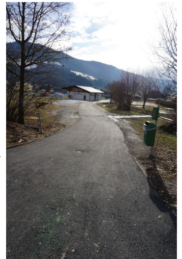
Der neu asphaltierte Weg mit Beleuchtung in Richtung Liedinger Allee!

Ein Umstand trübt jedoch das Gesamtbild. Wir kämpfen irgendwie vergeblich gegen den allgemeinen Trend aus ländlichen Gebieten in Städte oder deren Umland zu ziehen. Mehr als 100 von 132 Kärntner Gemeinden haben dasselbe Problem. Die Wohnbauförderung ist seit Jahrzehnten nicht darauf ausgerichtet, leerstehende Wohnungen am Land zu sanieren und für Mieter entsprechend preislich und wohnlich attraktiv zu erhalten. Stattdessen wird mit Neubauten in den Zentren ein zusätzliches Vakuum zu Lasten der ländlichen Gemeinden geschaffen. In dieser Frage wird meine Stimme aus der Oppositionsbank im Landtag leider nicht gehört.