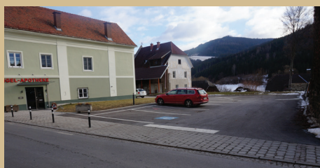
Der neu gestaltete Eingangsbereich der Engel-Apothek mit Parkplatz!

↳ Für 2019 wurde ein Antrag zur Sanierung der Sportlerkabinen eingebracht.