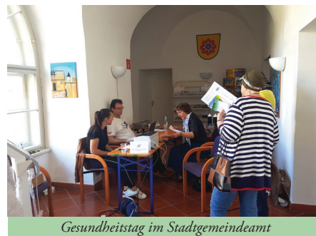
Gesundheitstag im Stadtgemeindeamt

Der Ausschuss für Familie, Schule, Sport u. Soziales hat in Zusammenarbeit mit dem Gesundheitsland Kärnten wieder einen Gesundheitstag am 14.04.2018