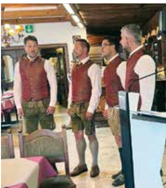
Quartett der SR St. Georgen