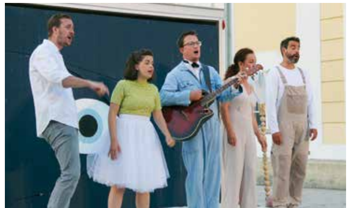
Das Ensemble des Theaterwagen Porcia schuf auch heuer wieder zauberhafte Theateratmosphäre am Straßburger Hauptplatz.

Viele Straßburgerinnen und Straßburger warteten auch in diesem Jahr wieder auf einen beliebten Fixtermin: der Theaterwagen Porcia öffnete am 24. August am Hauptplatz die Rampe und ein quirlig-lebhaftes Schauspielensemble begeisterte vorerst die Kinder mit „Wer findet die Glücks'chen?“ und anschließend mit dem österreichischen Theaterklassiker „Der Bauer als Millionär“ in einer gewohnt aktuell-zeitnahen Inszenierung.