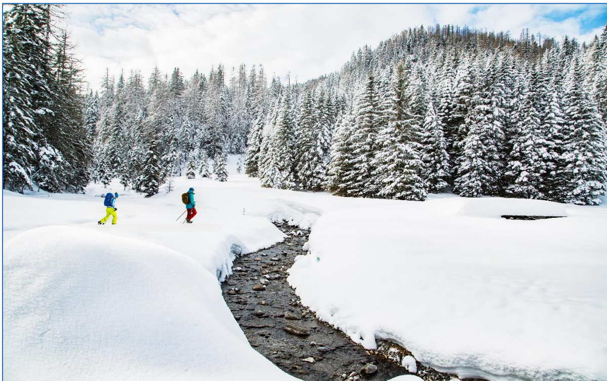
Flattnitz © Elias Jerusalem